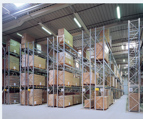
■ paletni regali za skladišča