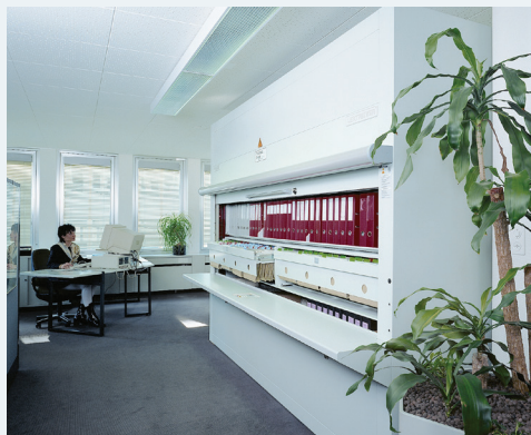
■ avtomatske kartotečne omare - vertikalno shranjevanje kartotek, materiala