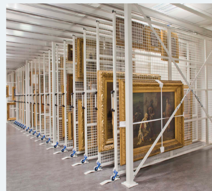
■ regali za muzeje - premične in izvlečne mreže za shranjevanje slik