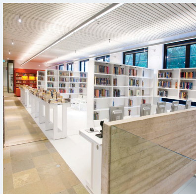
■ regali za knjižnice