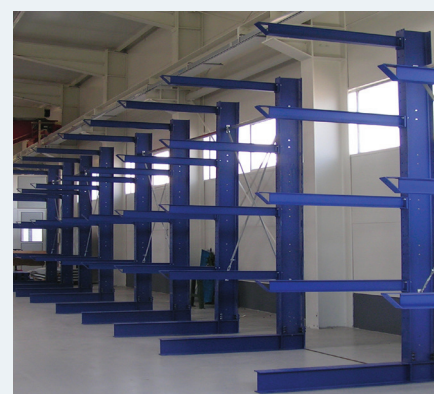
■ konzolni regali za skladišča