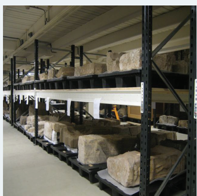
■ regali za muzeje - višja nosilnost za težje eksponate